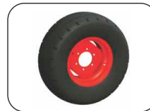
Pneus 11L15 para modelo 6.000