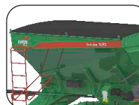
Conjunto Lona Fácil